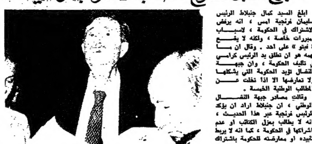
السيد كمال جنبلاط يلقى بصرجه

ابغ السيد كمال جنبلاط الرئيس سليمان فرنجية امس، انه يرفض الاشتراك في الحكومة، ولجميع ويريرات خاصة، ولكنه لا يقع «نيون» على احد. وقال ان ما يهمه هو ان تطلق يد الرئيس كرامي في تاليف الحكومة، وان جهة الاتصال تزد الحكومة التي يشكها ولا تعارضا الا اذا نزلت عن المطالب الوطنية الخفية.